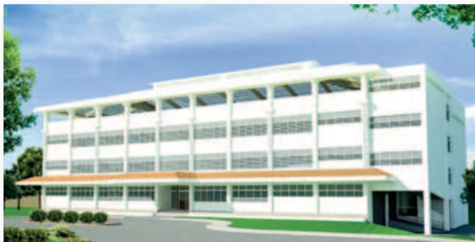
Voici à quoi ressemblera le bâtiment de l'école de garçons en Tanzanie.

C'est avec plaisir que nous vous informerons de l'avancée des deux nouveaux projets.